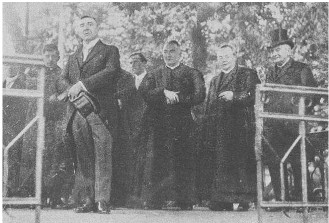
Dankwoord van de jubilerende burgemeester