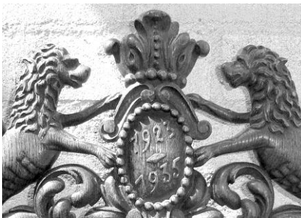
Detail van de Pankenstoel